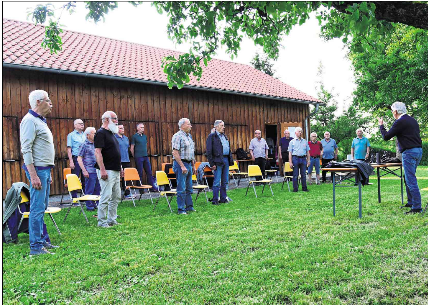
Endlich wieder gemeinsam singen: Der Liederkranz hat sich auf der Festwiese getroffen.

Trotz der Lockerungen kann das diesjährige Musik- und Gartenfest des Liederkranzes und der Städtischen Orchester nicht stattfinden. Die Vereine bieten an dem Festwochenende am Samstag, 10., und Sonntag, 11. Juli, stattdessen Essen to go an. Dies kann vorab bestellt werden, tagess- und zeitgenau unter der Telefonnummer 071 54/159 95 85 (Anrufbeantworter).